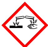
GHS05 Działanie żrące