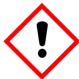
GHS07 Punto esclamativo