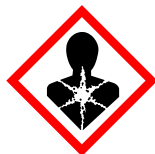
GHS08 Pericolo per la salute