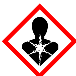
GHS08 Pericolo per la salute